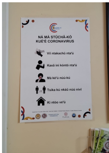
Figura 3: Las cinco sugerencias de salud y seguridad de la OMS en Sà'án Sàvì ñà Yukúnanĩ, póster colgado en la oficina de MICOP en Santa María, CA.

Como podemos ver en la imagen, las cinco sugerencias venían acompañadas de ilustraciones gráficas complementarias. Esta herramienta interactiva desarrollada por Translation Commons (s.f.) y PanLex permitía que cualquier usuario subiera versiones escritas o en audio, las cuales quedaban archivadas de manera gratuita y se podían descargar fácilmente como un póster que podía imprimirse en formato A4 o US Letter. Esta iniciativa llegó a conseguir versiones en más de 350 lenguas de todo el mundo, y el repositorio en línea, además, permitía añadir audio a los pósteres.