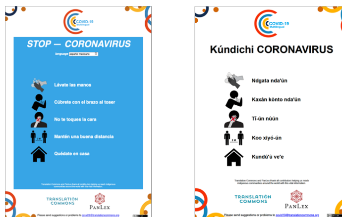
Figura 2: Las cinco sugerencias de salud y seguridad de la OMS: en español (izquierda), Tù'un nà ñuu Sàví de Tlahuapa (derecha)

Uno de los proyectos de traducción al que nos sumamos fue la iniciativa de Translation Commons COVID-19 Multilingual (Translation Commons, s.f.), que presentaba cinco sugerencias simples para evitar la propagación del COVID-19. En la figura 2, podemos ver las sugerencias de salud básica de la Organización Mundial de la Salud (OMS) que se adaptaron para este póster, en español (a la izquierda, capturada de la página web de Translation Commons), con nuestra traducción al Tù'un nà ñuu Sàví de Tlahuapa (Reyes Basurto y Peters, 2020a). En la figura 3 podemos ver la traducción al Sà'án Sàví ñà Yukúnani (Salazar et al., 2020) colgada en las oficinas de MICOP (Mixteco Indígena Community Organizing Project) en Santa María, CA.