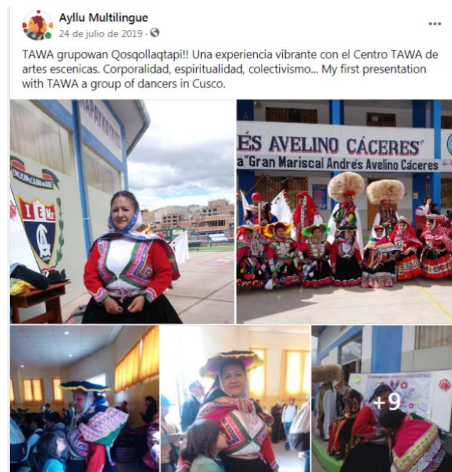
Imagen 17: Recuento en mi Facebook sobre la presentación con TAWA.