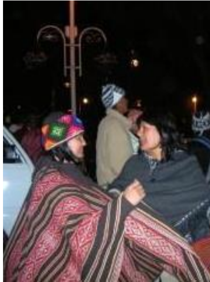
Imagen 2: En la verbena del Cusco con mi mama. A. Gamarra Zuñiga, 2001

No solo estos nombres de calles, o el himno del Qosqo 5 en quechua que sería adoptado como obligatorio en actos públicos de la ciudad, ayudaron a hacer visible el idioma quechua en la ciudad de mi infancia a la juventud; sino también, la sonoridad de protestas populares. Aunque el quechua es un idioma oficial del Perú desde el año 1975, los pueblos quechuas tienen una participación limitada en la educación, los servicios de salud y la economía del Perú debido a las prácticas coloniales institucionalizadas y la resolución vertical de los problemas sin aportes locales (Blanco, 2003; Kenfield, 2020; Supa Huaman, 2002).