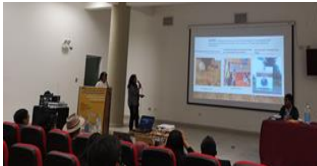
Imagen 4: Co-ponencia en Hatun Tinku 2019 Siminchispi Rimasun K'uskiyninchiskunamanta. D. Escobar Lopez, 2019.

Fue en dicho espacio que pude presentar dos de mis trabajos de investigación. Una de ellas como co-ponente bilingüe quechua-castellano (Imagen 4) sobre el trabajo participativo de acción para combatir ideologías de déficit sobre el bilingüismo quechua Castellano entre los universitarios. Me expresaría en un quechua que tenía que leer por temor a mi poca fluidez: Ancha kisisqan kashani imaqtinchus qankunawan hamut'ayninchiskunata rakinarikusunchis. Hoq yachaykunata k'uskiriy llank'ayniykunata universitario yachaqekunawanmi rimarayku imaytan noqachiskikillanchis sarunchakunchis imaynatataqmi kuskallamanta kallpayuq kasunman runasimi t'ikarichinapaq [hoy estoy muy feliz porque voy a compartir con Uds. reflexiones y aprendizajes resultantes de investigación con universitarios con quienes hemos discutidos sobre cómo nos autodiscriminamos y cómo podemos juntar esfuerzos para reactivar nuestro quechua] Esta ponencia la titulamos UNSAAC Hatun Yachaywasiaq Qheswasimi Yachaqninkunaq Rimariynin [Universitarios quechuahablantes discutiendo sobre su habla en la universidad]. Y la segunda presentación (Imagen 5) que iniciaría en quechua pero por falta de mi fluidez la continuaría en el castellano diciendo así: pampachaway ñañaturaykuna ama allintachu runasimta rimani, chayrayku castillasimi kunanqa rimasaq [discúlpenme hermanas y hermanos pues no hablo bien el quechua por eso ahora hablaré en castellano].