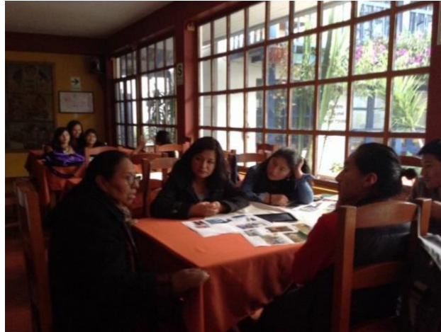
Imagen 14: Fotovoceros preparándose para su foto exhibición. Y. Kenfield, 2017.

A partir de esa experiencia, he mantenido esfuerzos colectivos como aliada del Voluntario Intercultural Hatun Ñan (Imagen 15) desde el 2017 hasta hoy. Durante el 2016 este grupo autofinanciaba todas sus actividades (foros, talleres, trabajo y social), pero luego de su activismo el 2017 lograron su reconocimiento como gremio estudiantil por medio de la Oficina de Proyección Social de la Universidad San Antonio Abad del Cusco justo luego de que acabáramos la foto exhibición sobre la problemática y las posibilidades para promover el quechua en la comunidad universitaria.