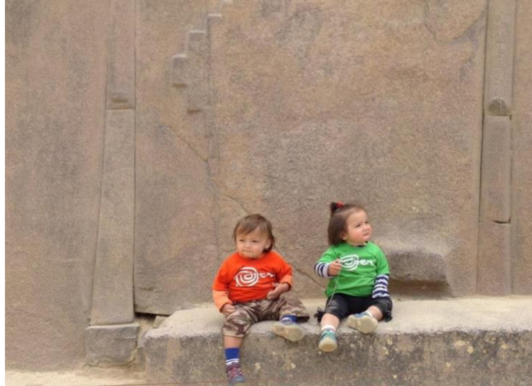
Imagen 3: Chaski y T'ika bajo una chakana en Ollantaytambo. M. Medrano, 2014.

Y fue por esta oleada de visitas al Cusco por investigadores lingüistas, arqueólogos o antropólogos que muchos quechuahablantes se convirtieron en informantes y colaboradores durante, probablemente, las últimas 6 décadas. Al día de hoy, los lingüistas comúnmente no son personas locales. Hay explicaciones muy simples para eso. Una explicación sería el hecho de que no existe la carrera de lingüística en la región del Cusco. La universidad más antigua pública: La Universidad San Antonio Abad del Cusco ha estado en la ciudad por más de 300 años y al día de hoy ofrece 32 carreras profesionales; sin embargo, no existe la carrera de lingüística como tampoco existen las carreras de sociología, literatura, y demás. Recientemente en menos de cinco años fue creada la carrera de psicología. Y la otra razón principal por la cual los lingüistas que han estudiado por tantas décadas la situación del lenguaje en el Cusco son extranjeros o académicos de universidades latinoamericanas, no local, es debido a los financiamientos extranjeros que atienden agendas globales e internacionales.