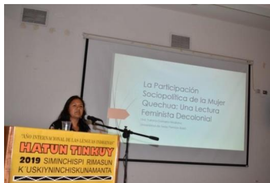
Imagen 5: Ponente en Hatun Tinku 2019 Siminchispi Rimasun K'uskiyninchiskunamanta. I. Cereceda, 2019.