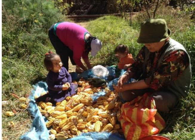
Imagen 11: Desgranando la cosecha de la chakra en Coya.