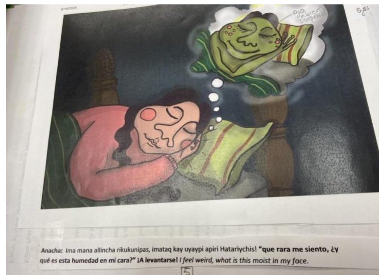
Imagen 18: Página cinco del borrador de Anachaq Mosqhosninpa Willakuy/El Sueño Revelador de Anacha/ Anacha's Revealing Dream. Y. Kenfield, 2021.