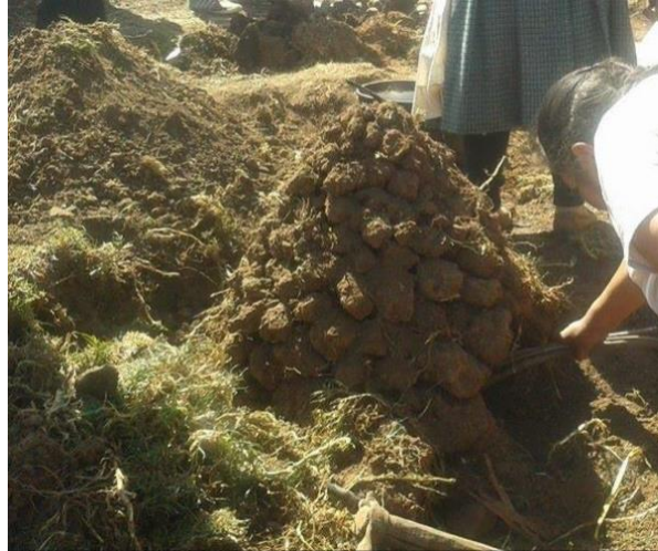
Imagen 9: Horno de Wat'ia en el área de Sacsayhuaman. Y. Gamarra Medrano, 1999.

Es así que uno escucha desde contemporáneas cuestiones políticas lejanas a cuestiones más cercanas donde se afirman ciertas creencias sociales tales como la importancia de las matemáticas, el chisme sobre algún otro pariente ausente, la comparación con el otro, discursos sutilmente autodiscriminatorio y autoracista, confirmación de identidad mestiza, o de recuento de hazañas laborales. Cuántas veces no he oído y sentido la colonialidad y descolonialidad entre los discursos de mis parientes. Algunas veces he tenido que regular como otros sobre la mirada de déficit hacia nuestra propia sangre, y otras tenía sentido para mi unirse a las bromas como la frase harto conocida ¿eres Inka o In(k)apaz? En estos espacios de diálogos como en la wat'ia siempre implican colaboración, reafirmación de saberes alimenticios y medicinales, bromas, e indirectas críticas. Hay comentarios inmediatos de cómo salió el sabor de las papas, de quien trajo las oqas, que tan bien construido estuvo el horno, de quien preparó la uchukuta, se requiere entregar lo mejor de ti para compartir con tu familia por que los quieres y también porque habrán críticas duras. Y siempre recordando el convite de bebida para la tierra antes de comer la wat'ia, es así que se reproduce la tink'asqa palabra del quechuañol que se refiere al echar un poco de bebida, que suele ser la chicha de maíz, a la pachamama antes de beber uno.