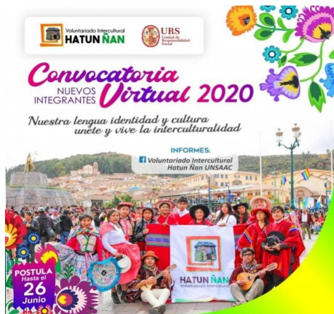
Imagen 15: Convocatoria del Voluntario Intercultural Hatun Ñan. N. Gomez Gomez, 2020.

A partir de esa experiencia, he mantenido esfuerzos colectivos como aliada del Voluntario Intercultural Hatun Ñan (Imagen 15) desde el 2017 hasta hoy. Durante el 2016 este grupo autofinanciaba todas sus actividades (foros, talleres, trabajo y social), pero luego de su activismo el 2017 lograron su reconocimiento como gremio estudiantil por medio de la Oficina de Proyección Social de la Universidad San Antonio Abad del Cusco justo luego de que acabáramos la foto exhibición sobre la problemática y las posibilidades para promover el quechua en la comunidad universitaria.